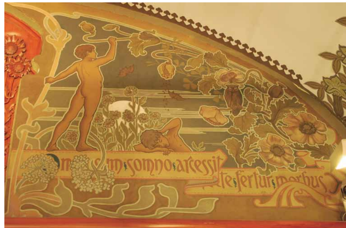
Painting depicting pharmaceutical allegories for preparing narcotics. Detail of the right-hand panel of an interior wall

surrounded by poppies, a highly representative plant in Modernista pharmacies. Inside, several paintings depict pharmaceutical allegories. The side walls display the names of four pharmacists whom Antoni Novellas admired, Fors, Carbonell, Scheele and Lemery – two from Barcelona and two foreigners – who all lived from the 17th to 19th centuries. They are accompanied by the cup and serpent which are the symbols for pharmaceutical science. Since the times of classical mythology, the cup has been linked to medicine and the serpent