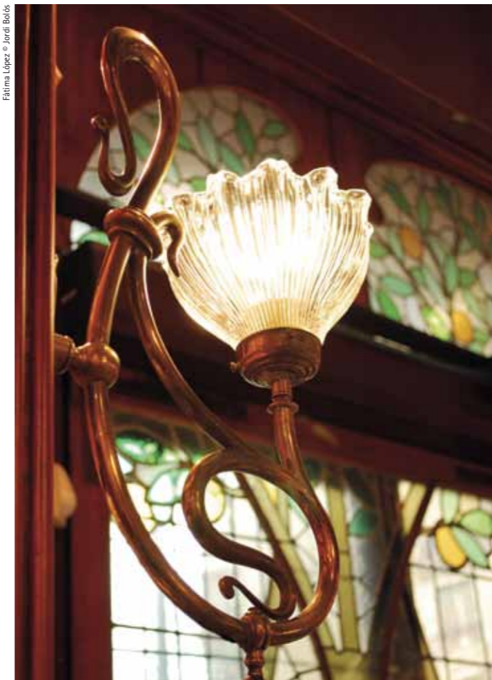
Original wall lamp attached to the cabinets, following the "coup de fouet" or whiplash line Aplic original afegit als armaris que segueix la línia "coup de fouet"