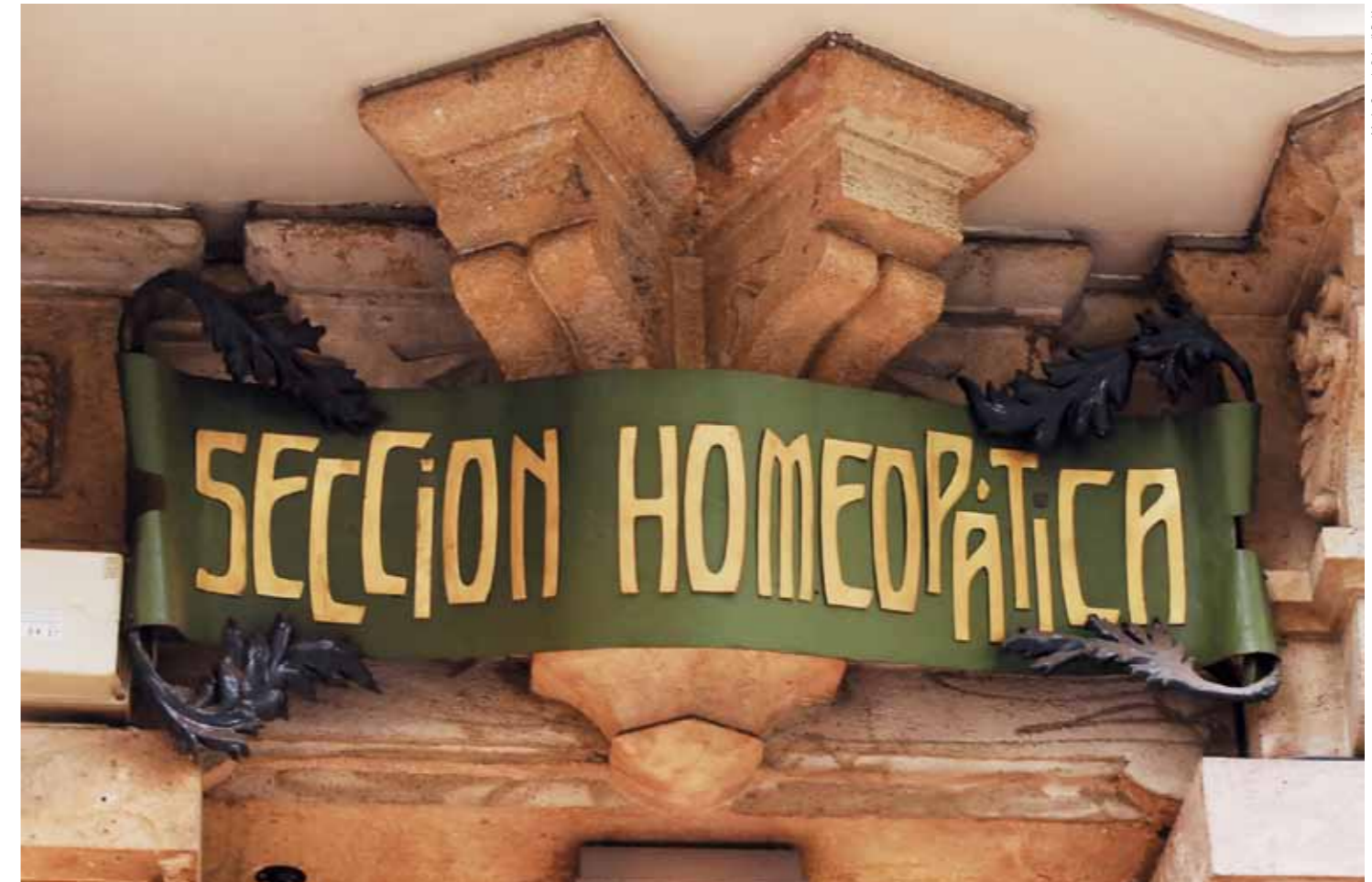
Original exterior sign of the homeopathic section, opened in 1906 / Cartell exterior original de la secció homeopàtica, inaugurada el 1906