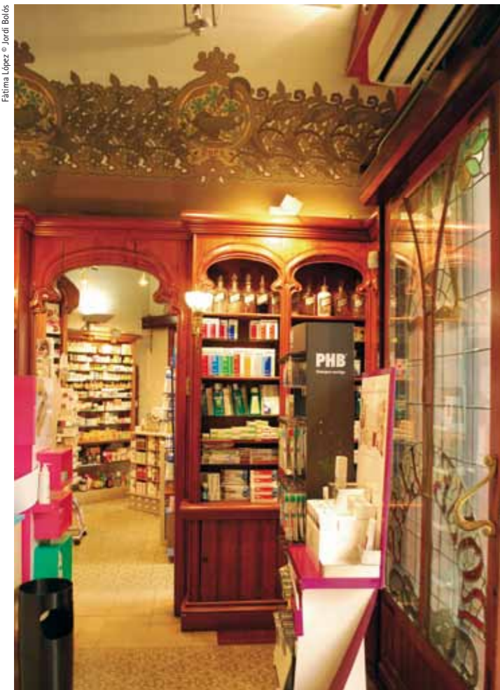
Recent general view of the interior of the pharmacy Vista general actual de l'interior de la farmàcia

La decoració també presenta connotacions simbòliques. Així, a la porta principal es representa en vitrall un taronger, un arbre que posseeix diverses propietats farmacològiques, amb el cognom de Novellas. Damunt hi ha el rètol amb el nom de la farmàcia envoltat de cascalls, la planta més representativa en les farmàcies modernistes. A l'interior hi ha pintades unes al·legories farmacèutiques, i a les parets laterals hi apareixen els cognoms de quatre farmacèutics que Novellas admirava: Fors, Carbonell, Scheele i Lemery –dos barcelonins i dos estrangers, tots ells van viure entre els segles XVII i XIX–, acompanyats de la copa i la serp, símbols de la ciència farmacèutica. Des de la mitologia clàssica, la copa ha estat lligada a la medicina, i la serp s'associa a la salut per les propietats curatives contingudes en el seu cos. La representació de plantes i flors medicinals continua tant a l'exterior com a l'interior de l'establiment, com passa a moltes altres farmàcies d'aquest període, que tenen com a tema decoratiu predominant l'ornamentació vegetal. A la sala annexa dedicada a la secció d'homeopatia, inaugurada més tard, el 10 de juny de 1906, s'enriqueix la representació de botànica utilitzada en aquesta disciplina. L'arc de fusta que predomina en aquesta sala té en els seus laterals inferiors unes vidrieres decorades amb flors i de la part superior pengen uns llums dels quals s'enfila l'heura.