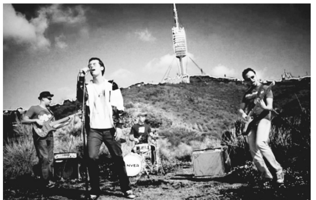
La formación Denver, protagonista del Banc de Proves.