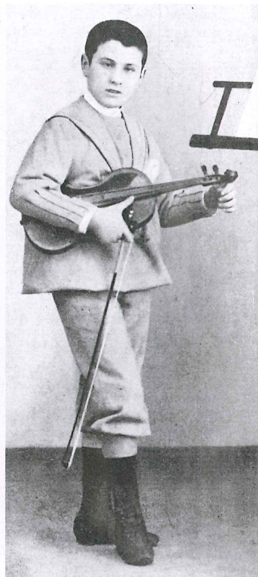
A dalt a l'esquerra, una fotografia típica de Manén, amb la seva particular manera de col·locar la mà que va convertir en una marca de fàbrica. Al costat, Manén quan tenia 7 anys. A la dreta, i de dalt a baix, el mestre en una entrevista al seu estudi i donant el seu violí Maggini, el 1964, a València