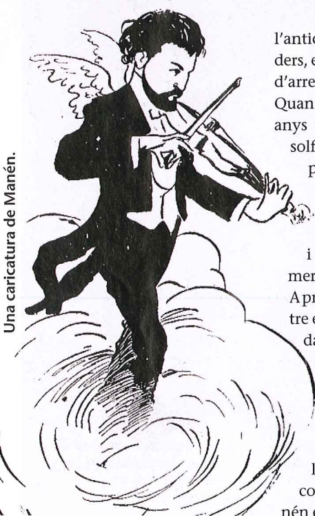
Una caricatura de Manén.

De tota manera, Joan Manén seguirà tocant sempre, pràcticament fins poc abans de la seva mort. Els últims anys els passarà al seu pis del carrer Taverner, com-