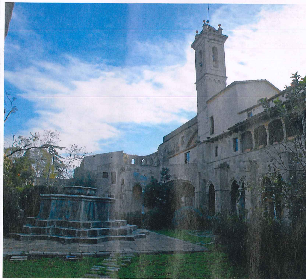
La font del claustre, desproporcionada a cop d'ull, imponent des de dalt.

Qui se'n recorda? Un camí d'accés al monestir i un cadenet ben peculiar. Mirat amb detall, l'entorn del monestir podria millorar. En èpoques com aquesta, de retallada general, no sembla prioritari.