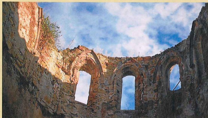
Actuacions. A banda d'algunes intervencions puntuals, no s'ha abordat una restauració d'envergadura d'aquest bé cultural d'interès nacional, que està en mans privades. / ALBERT LLORETA / ALBERT TRAVER