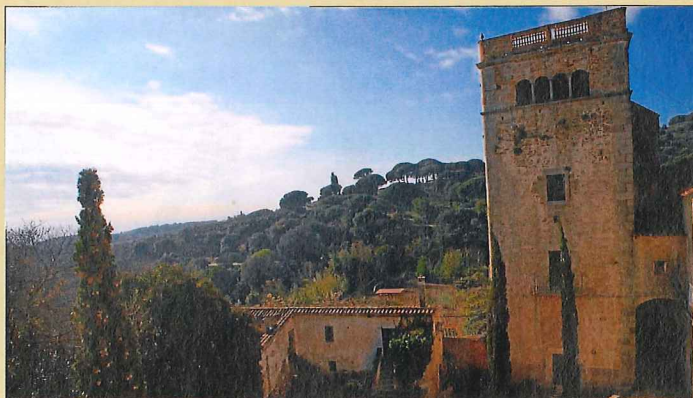
Sense monjos. El monestir data del segle XV i és l'únic cenobi jerònim que resta dempeus a Catalunya. Els monjos el van abandonar el mes de juliol de l'any 1835.