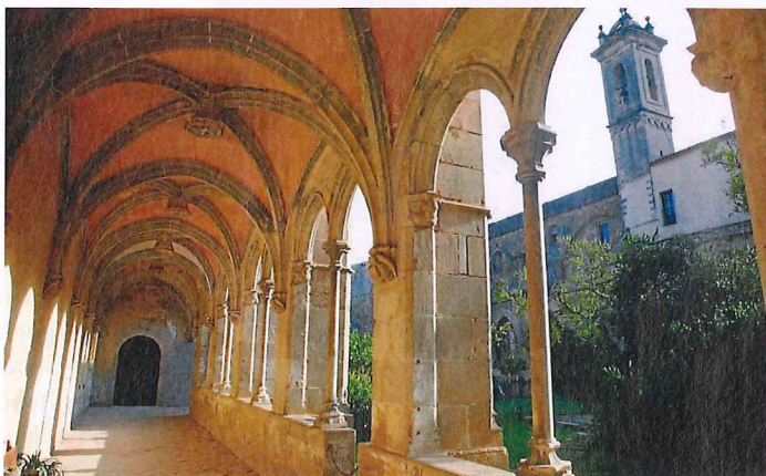
El claustre de Sant Jeroni. / ALBERT LLORETA / ALBERT TRAVER

és massa costós. Una segona opció seria trobar un inversor privat, com en el cas de Sant Benet de Bages, gestionat per la fundació de l'antiga Caixa Manresa. Un altre format és el del monestir de Sant Cugat, convertit en el museu de la població. Quin d'aquests models funcionaria a Sant Jeroni? O potser cal trobar-ne un d'específic?