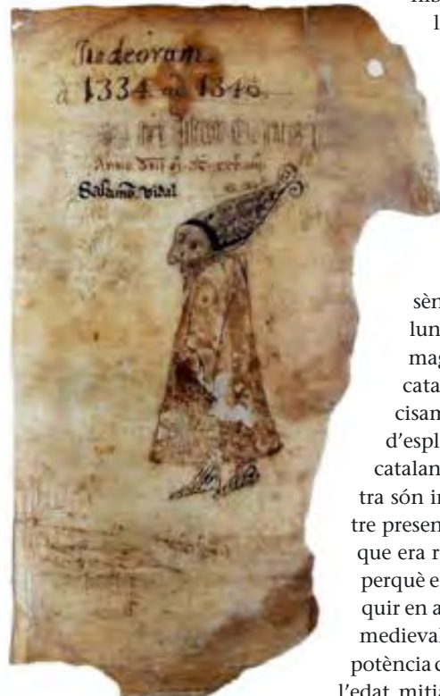
Dibuix que recrea Salomó Vidal, jueu prestador de Vic (segle XIV). Conservat a l'Arxiu Episcopal de Vic, Cúria Fumada.

A Barcelona hi havia la comunitat més gran: quasi 5.000 persones. A Perpinyà i Girona, prop de 1.000. A Lleida, mig miler. A Tortosa i a Cervera, poc més de 300. A Castelló d'Empúries, Solsona, Balaguer, Tàrraga i Besalú, entre 100 i 200. Després dels atacs i massacres del 1391 i de l'onada de conversions, la població decau fins a les 2.000 persones el 1419, i eren 1.500 en el moment de l'expulsió.