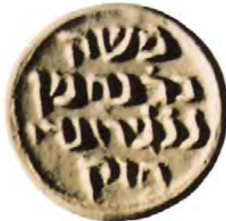
Ramban. Segell del rabí Mossé ben Nahman de Girona (s. XIII) conservat al The Israel Museum, a Jerusalem.