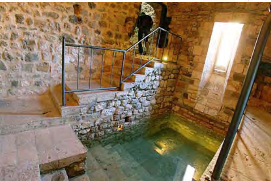
El micvé de Besalú, del segle XIII, l'únic que es conserva a la península Ibèrica.