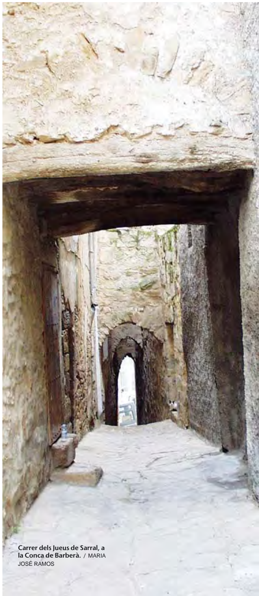
Carrer dels Jueus de Sarrià, a la Conca de Barberà.