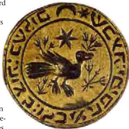
Per marcar pa sense llevat. Segell per marcar pans àzims de Pasqua, de l'Espluga de Francolí (s. XIV). (Còpia) Museu d'Història dels Jueus, a Girona.

sives, sobretot arran del dia fatídic de Sant Llorenç, el 10 d'agost, del 1391. Van ser atacats, brutalment linxats, al crit: «Que els juheus es facen christians o que muyren.» Centenars de persones van ser assassinades, forçades a la conversió o exiliades. La conjuntura ho havia afavorit: les prèdiques incendiàries a favor de la conversió –a la sinagoga mateix– del pare dominic valencià Vicenç Ferrer (València, 1350 - Gwened, Bretanya, 1419), la fam, la guerra, la crisi, els deutes, el malestar general... Fins que van haver d'anar a l'exili, abans o després del decret d'expulsió ideat per l'inefable fra Tomàs de Torquemada.