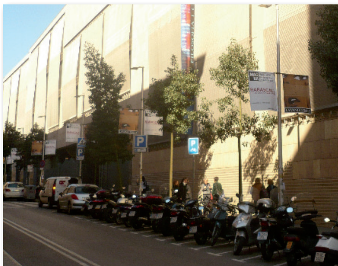
Imatge del carrer Montalegre on trobem la seu de la facultat de Filosofia de la Universitat de Barcelona.

Ara per ara no s'han acomplert les prediccions