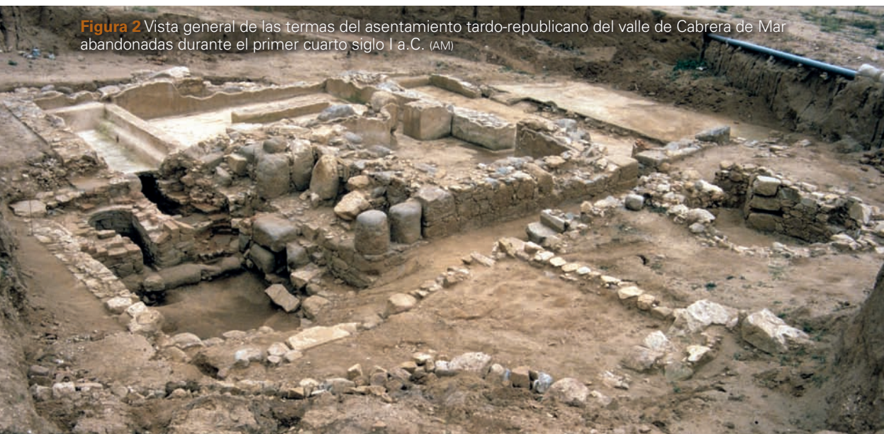
Figura 2 Vista general de las termas del asentamiento tardo-republicano del valle de Cabrera de Mar abandonadas durante el primer cuarto siglo I a.C. (AM)