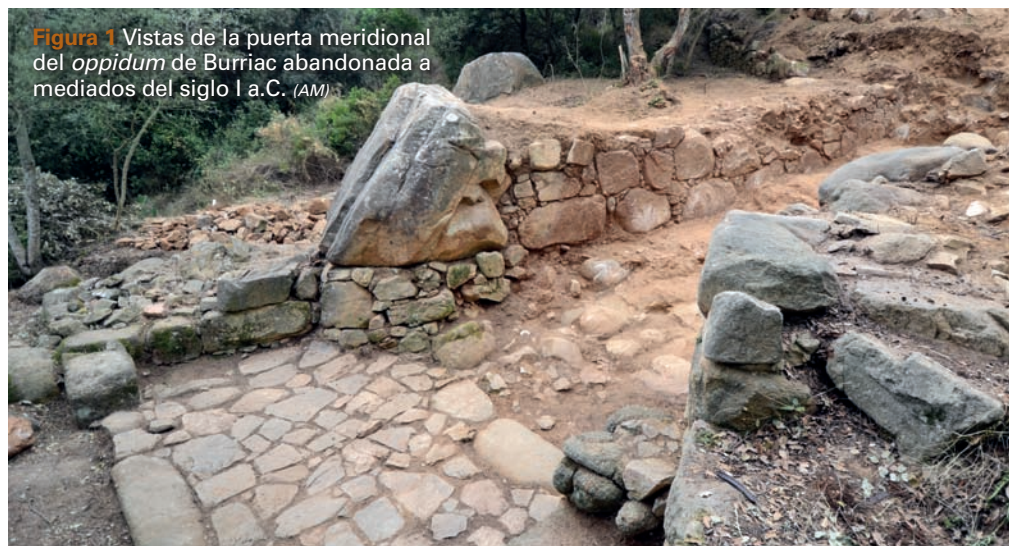
Figura 1 Vistas de la puerta meridional del oppidum de Burriac abandonada a mediados del siglo I a.C. (AM)

Del total de las monedas analizadas en este trabajo, 173 corresponden al oppidum ibérico de Burriac ( Figura 1 ), las cuales, de acuerdo con los análisis de los materiales