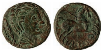
Figura 4 Mitad de Iltirkesken , segunda mitad del siglo II a.C. (DMCB)

Destaca la relevancia de la moneda fraccionaria en uso, que llega a representar un 39,13% del total de la moneda circulante en este periodo. Las monedas con valor mitad son las más utilizadas ( Figura 4 ), con un 55,54% del total de los divisores en uso; el resto son tercios y cuartos a partes iguales (22,23% cada valor).