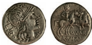
Figura 3 Denario forrado de Roma, posterior al 148 a.C. (DMCB)

De los 13 denarios que aquí se publican, cinco de ellos son ibéricos, uno de la ceca de Itiúrta y cuatro de la ceca de Bolskan . El resto pertenece a la ceca de Roma. Es importante destacar que mientras que los cinco denarios ibéricos parecen ser auténticos, no podemos decir lo mismo de los denarios romano-republicanos, pues al menos tres de ellos son piezas forradas.