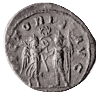
Antoninià encunyat per Galié, en una seca oriental, cap al 260 d.C. Pertany al tresor de les Alqueries (x 2).