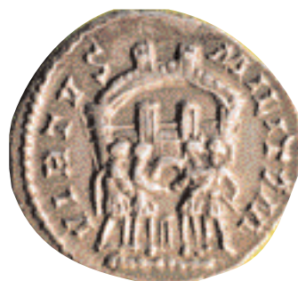
Argenteus acuñado por Maximiano (286-305 d.C.). Fue de plata de buena ley, pero no se acuñaron los suficientes como para que no se atesoraran rápidamente (x 2,5).