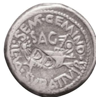
As de Saguntum amb la galera militar en el revers, encunyat a nom de Tiberi (17-37 d.C.). Una elevada quantitat d'ells van ser contramarcats amb les sigles D(ecreto) D(ecurionum) , amb una finalitat no coneguda (x 1,5).