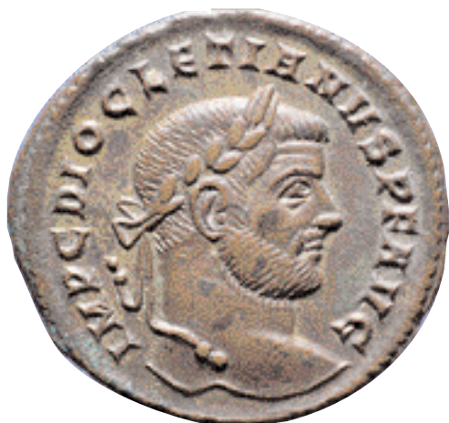
Nummus encunyat per Dioclecià, a Siscia. 295 d.C. (x 2).