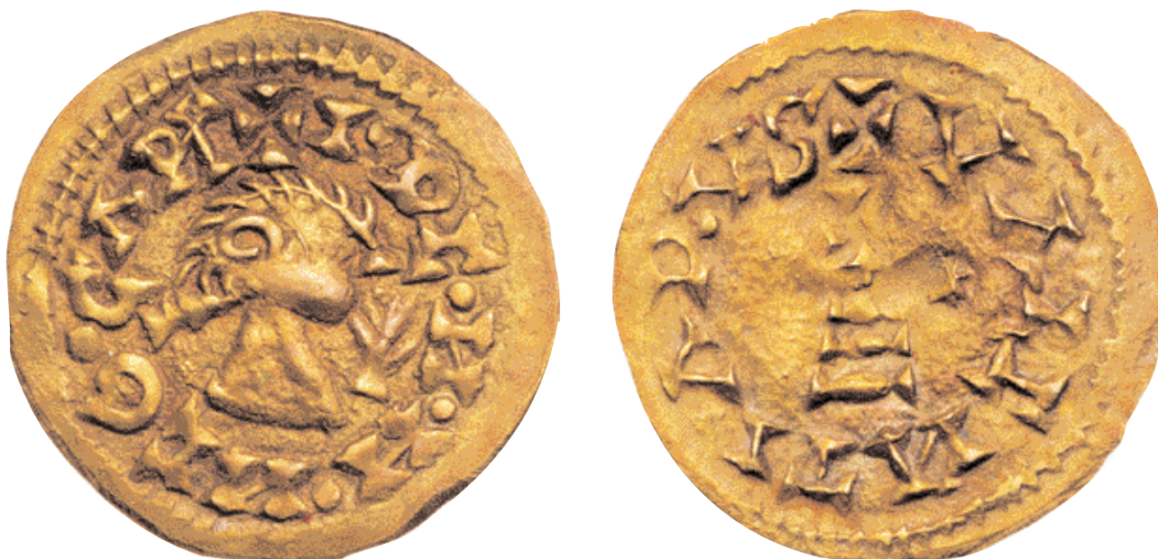
Trient d'Ègica (687-702) encunyat a Valentia (ANS) (x 4).

En època romana los alimentos básicos de la dieta alimenticia eran el trigo y el vino por lo que su precio en el mercado puede ayudar a conocer qué tipo de valores eran los que se utilizaban en las transacciones diarias. Las referencias de precios del trigo aluden habitualmente al modius (8,754 litros). El modius de trigo podía costar en época altoimperial entre 2 y 4 sestercios y algunas piezas de pan de Pompeya valían 2 ases; en cambio, en el siglo iv, según el Edicto de Diocleciano el Kastrensis modius debía costar como máximo 100 denarios. El precio del vino variaba según su calidad. En Pompeya, por ejemplo, su precio oscilaba entre 12, 24 y 48 sestercios por ánfora. En el siglo iv d.C. un sextarius de vino itálico costaría como máximo 30 denarios.