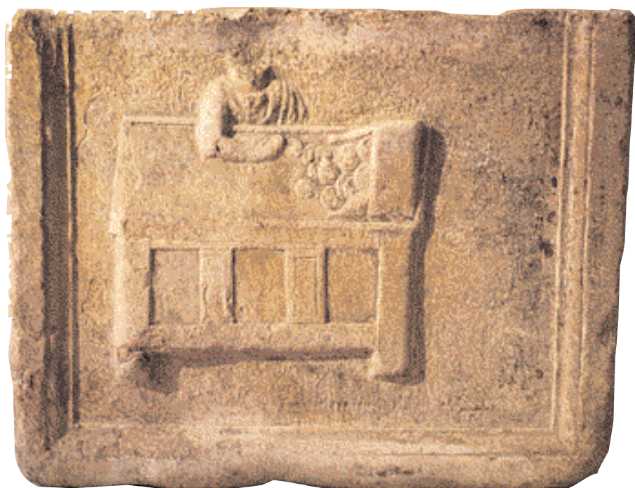
Mensa d'un nummularius del segle II d.C. Un personatge representat darrere d'una taula prou alta; sobre el taulell en la part de la dreta pareix representar-se una caixa d'on s'escapen monedes. (Sarcòfag del Museu de Ravenna).