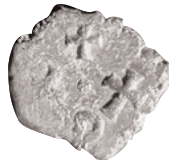
Mig folles de Justinià II de la seca de Carthago (686-687), procedent de Santa Pola (x 3,5).