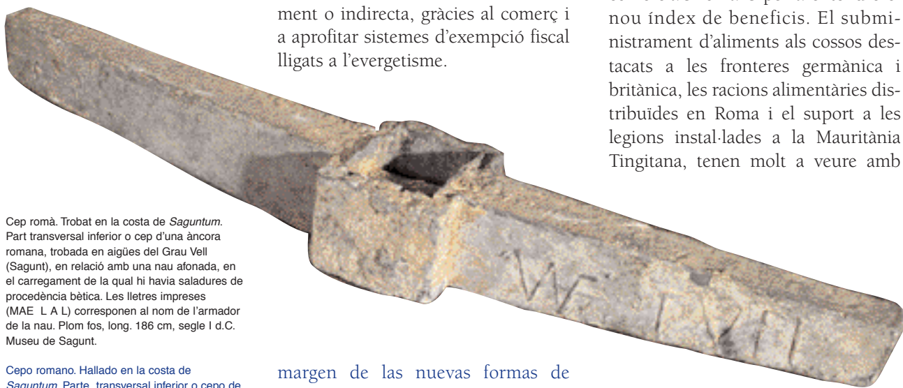
Cep romà. Trobat en la costa de Saguntum . Part transversal inferior o cep d'una àncora romana, trobada en aigües del Grau Vell (Sagunt), en relació amb una nau afonada, en el carregament de la qual hi havia saladures de procedència bètica. Les lletres impreses (MAE L A L) corresponen al nom de l'armador de la nau. Plom fos, long. 186 cm, segle I d.C. Museu de Sagunt.

A vegades s'ha pogut demostrar la inversió de riques famílies itàliques a Hispània però, per a l'àrea valenciana, la cosa més habitual són les mostres d'enriquiment de l'oligarquia provincial que actua dedicant una activitat important a l'explotació tant de l'oli, com del vi o a la producció de salses de peix amb vista a la seua comercialització. L'essencial de tots eixos recursos era conegut amb anterioritat a la romanització, si bé és fonamental l'ampliació dels circuits comercials romans per a entendre el nou índex de beneficis. El subministrament d'aliments als cossos destacats a les fronteres germànica i britànica, les racions alimentàries distribuïdes en Roma i el suport a les legions instal·lades a la Mauritània Tingitana, tenen molt a veure amb