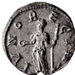
Antoniniano acuñado en Roma por Galiano, a nombre de su esposa Salonina. Pertenece al tesoro de Les Alqueries (x 2).

una proporció del 5 % d'argent i d'una lliura de metall es fabricaven 84 peces (3,89 g). Esta moneda no circulà uniformement per tot l'Imperi, de fet és molt escassa en l'àrea valenciana, i en aquells llocs a on no arribà es continuaren usant els antoninians anteriors i, sobretot, les imitacions.