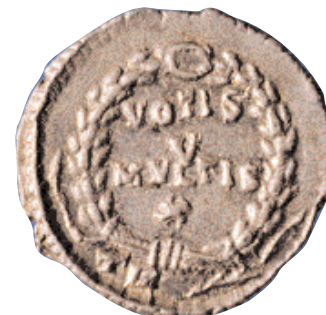
Silicua de Julià II, encunyada a Trèveris. 360-363 d.C. En la segona meitat del segle IV es va produir un increment en l'ús de moneda de plata (x 2,5).