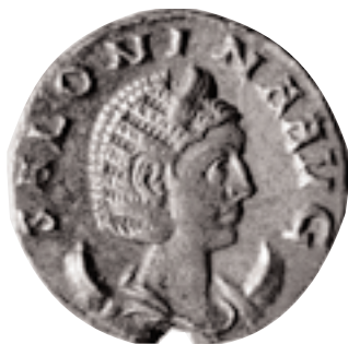
Antoninià encunyat a Roma per Galié, a nom de la seua esposa Salonina. Pertany al tresor de Les Alqueries (x 2).