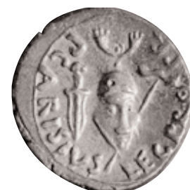
Denario de Augusto, acuñado en Emerita , ca 25-23 a.C. (x 2).