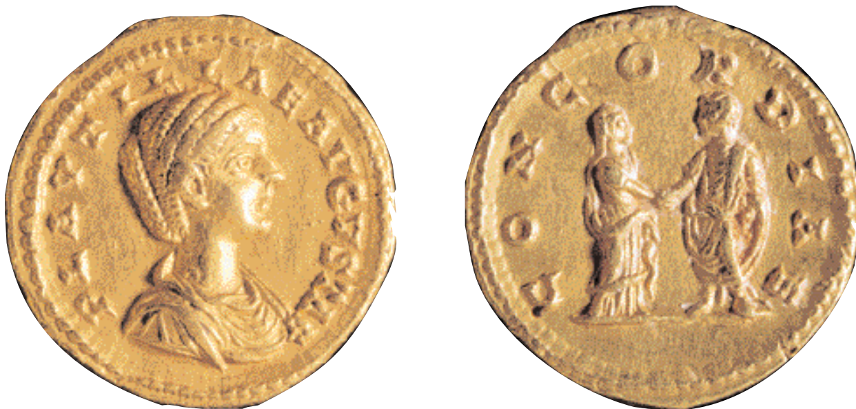
Aureo de Plautilla, esposa de Caracalla, acuñado en Roma antes de su muerte (211 d.C.). (Universitat de València) (x 3,5).

lica y se convirtió en una unidad de cuenta. Todavía el denario circuló unos cuantos años, pero con Trajano Decio fueron retirados de la circulación y reutilizados como flanes para acuñar nuevas monedas.