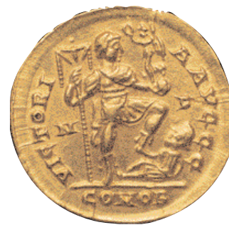
Sou ( solidus ) d'Honori, encunyat a la ciutat de Mediolanum (Milà). Pertany al tresor de la l'Alcúdia d'Elx, que és un exemple d'atresorament de moneda d'or i de joies produït a començament del segle V d.C. (x 2)