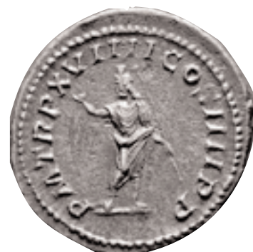
L'antoninià creat per Caracal·la tenia per objecte substituir el denari que es trobava molt devaluat. Antoninià de Caracal·la, 216 d.C. (x 2).