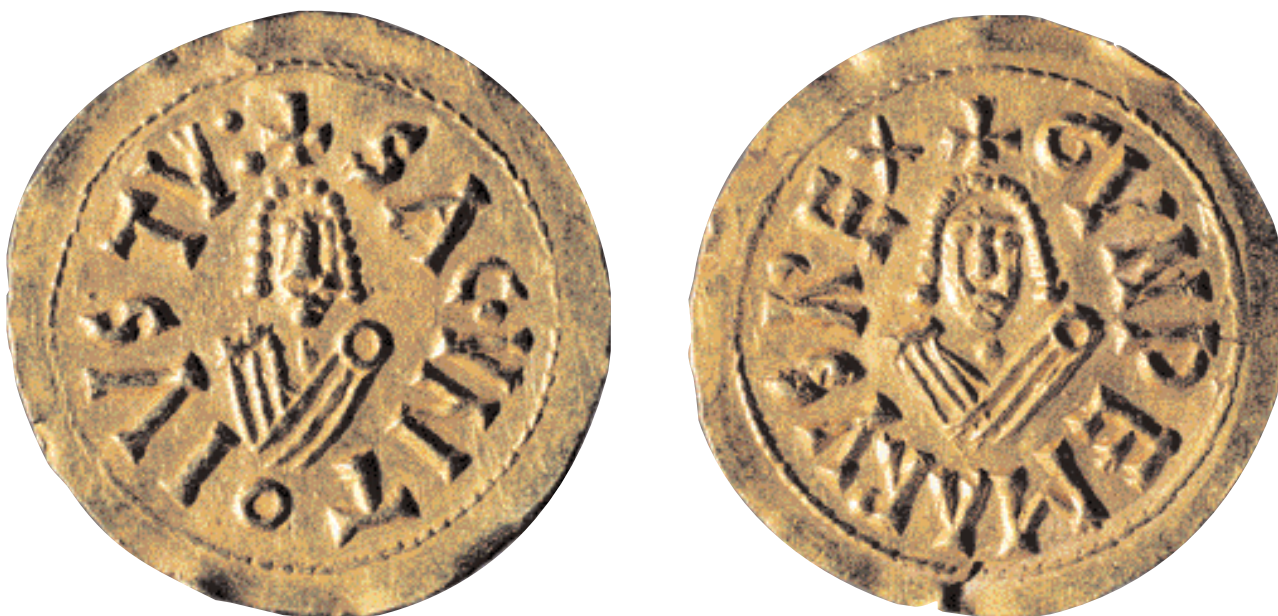
Triente de Gundemaro (610-612 d.C.) de la ceca de Sagunto (MNAC, Calveras, Mérida, Sagristà) (x 4).

se utilizaba con la misma finalidad y así parece desprenderse de los datos proporcionados por los tesoros de moneda de bronce ocultados en Hispania durante el altoimperio. Estos tesoros son en su mayoría de tamaño reducido y están compuestos por monedas de escaso valor, por lo que probablemente sus propietarios pertenecían a aquellos sectores más desfavorecidos de la sociedad para quienes un pequeño lote de monedas de bronce era una considerable riqueza. En la zona valenciana se han documentado diferentes tesoros de este tipo: Horta Seca, Alaquàs, El Madrigal y el Tossal de Manises, por citar algunos ejemplos. La moneda es un medio de cambio cuando sus valores están en relación con los precios de las transacciones cotidianas y su equivalencia es estable. Los datos proporcionados por las excavaciones arqueológicas realizadas en algunos núcleos urbanos de Hispania donde aparecen monedas de oro, plata y bronce, reflejan que en las transacciones económicas se utilizaban todo tipo de denominaciones, si bien en el conjunto de la masa monetaria suele prevalecer la moneda de bronce.