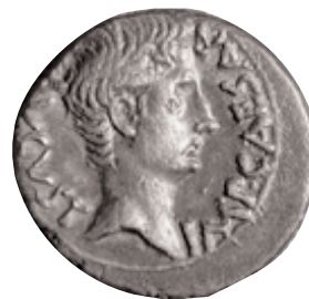
Denari d'August, encunyat a Emèrita , ca. 25-23 a.C. (x 2).

En el món romà l'auri ( aureus ) fou la moneda d'or per excel·lència. Des de Cèsar, la seua encunyació es féu cada vegada més regular. Després de la seua mort, durant les últimes guerres civils, les faccions enfrontades en la contesa