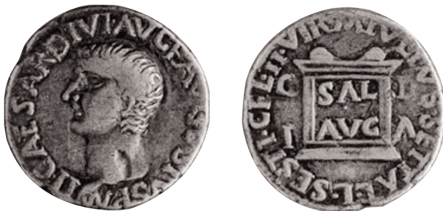
A Ilici , igual que en altres seques provincials, la reforma d'August arribà tard i els asos s'emeteren en coure durant el regnat de Tiberi (14-37 d.C.) (x 2).

L'Estat romà afavorí l'ús de moneda, sobretot pel fet d'haver d'afrontar les despeses que ocasionava el manteniment d'un enorme exèrcit i del seu siste-