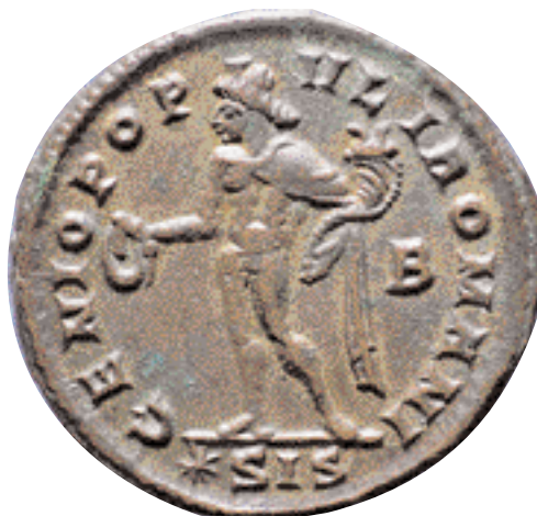
Nummus acuñado por Diocleciano, en Siscia. 295 d.C. (x 2).