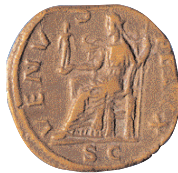
Sesterce de Júlia Mamea, mare de l'emperador Alexandre Sever. S'encunyà a Roma abans de la seua mort ocorreguda l'any 235 d.C. (x 1,5).