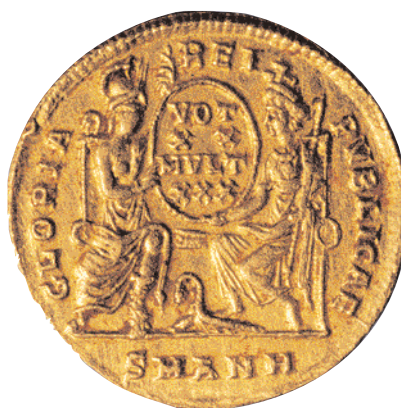
Sólido de Constancio II, acuñado en Antioquia. Fue la moneda de oro del Bajo Imperio (x 2,5).