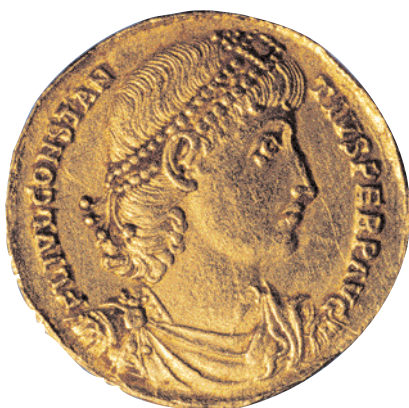
Sou ( solidus ) de Constanci II, encunyat a Antioquia. Fou la moneda d'or del Baix Imperi (x 2,5).