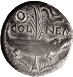
Nemausus i Roma foren les seques imperials que tingueren una major difusió a Hispània. As de Nemausus , 10-14 d.C. (BM) (x 1,5).