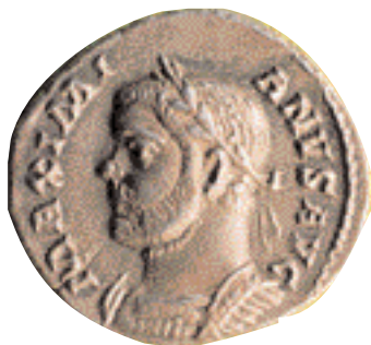
Argenteus encunyat per Maximia (286-305 d.C.). Va ser de plata de bona llei, però no se'n van encunyar prou perquè es pogueren atresorar ràpidament (x 2,5).