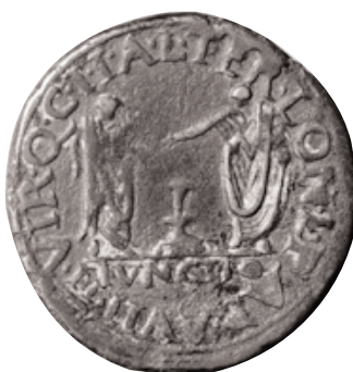
As d'Ilici, encunyat per Tiberi. En el revers, dues figures togades es donen la mà en senyal d'amistat. Es desconeix la seua identitat (x 1,5).